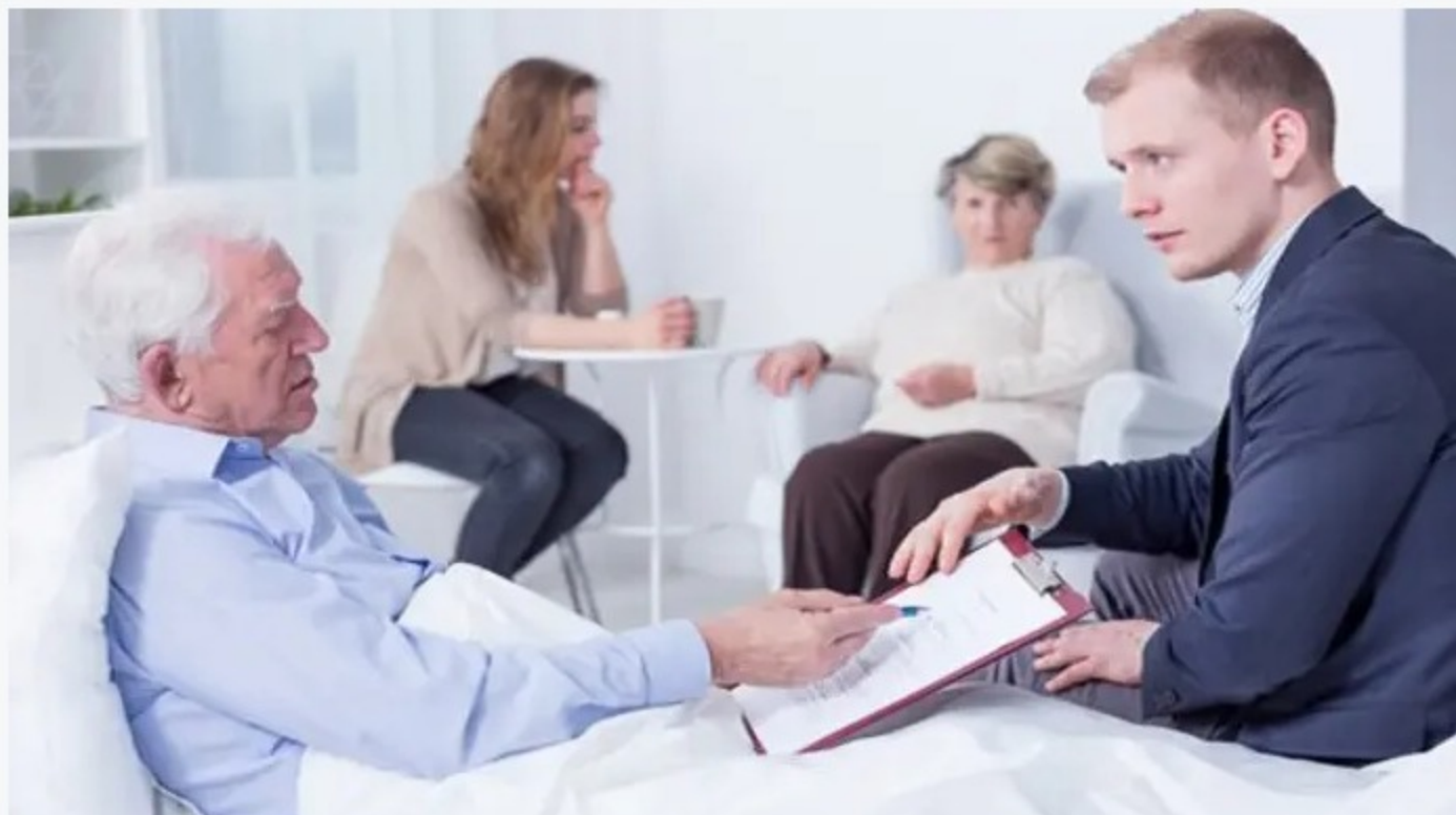
חתימה על צוואה

תגיות: מעריב משפטי / דיני משפחה / צוואות וירושות