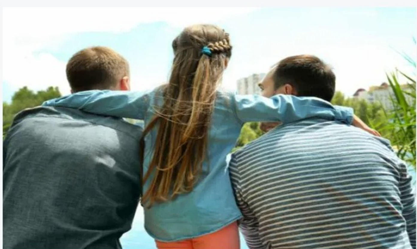
הורות להט"בית

תגיות: פונדקאות / מעריב משפטי / אימוץ ילדים